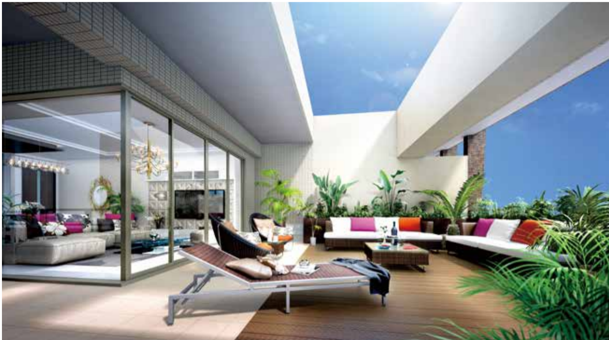
DタイプCGパース ※掲載のCGパースは、設計図を基に書き起こしたもので、実際とは多少異なる場合がございます。

ルーフバルコニー面積 / 32.93㎡ (9.96坪) ポーチ面積 / 2.25㎡ (0.68坪)